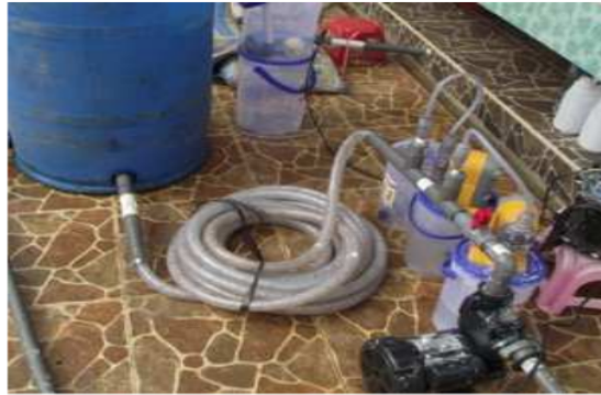
Gambar 2. Foto Proses Koagulasi Model Pipa Melingkar (Hamzani, 2013)